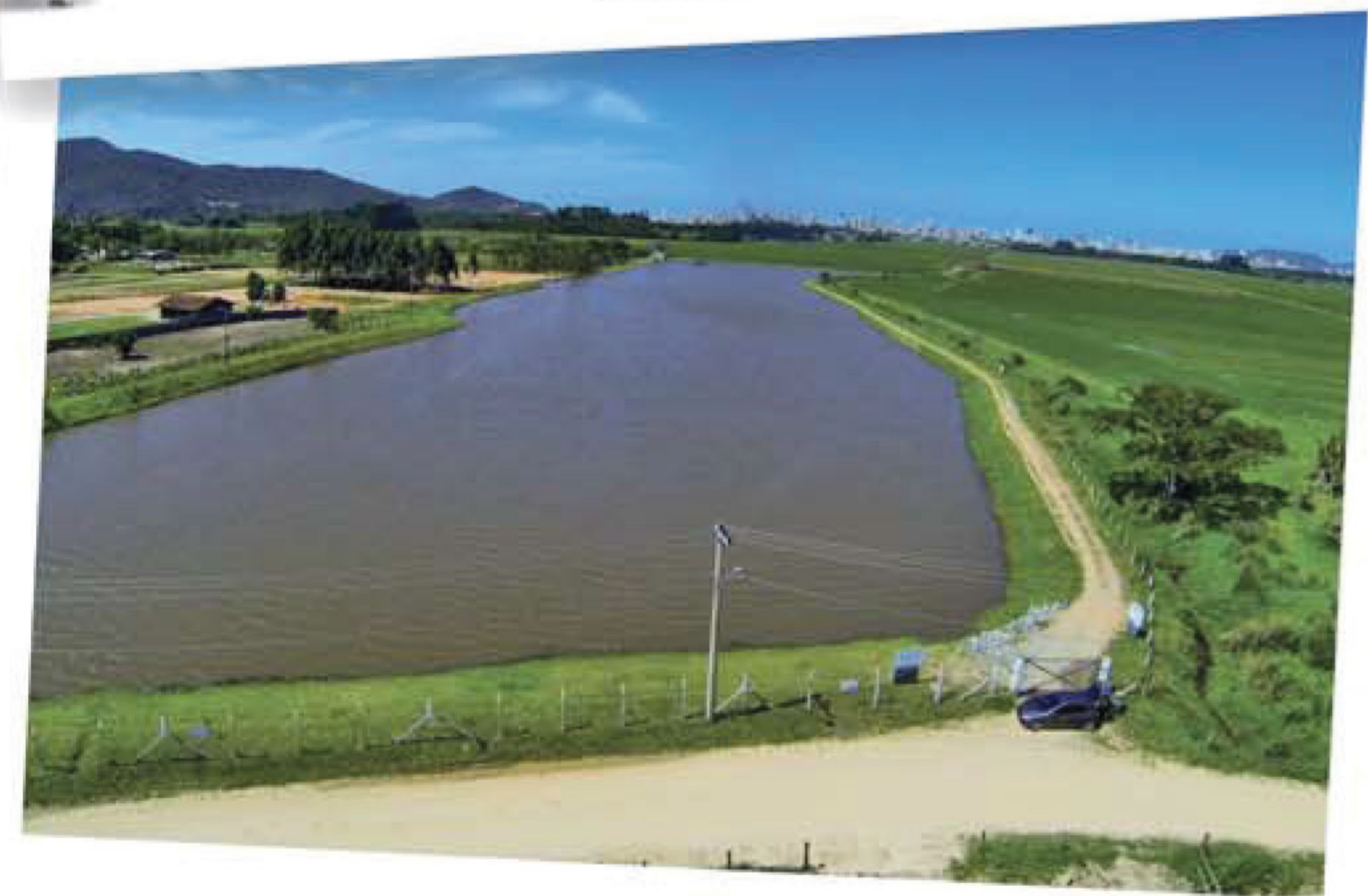
Lagoa de reservação de água

Os investimentos realizados pela Conasa Águas de Itapema em 2014 garantiram o fornecimento de água para todo o município no alto verão de 2015 e durante toda a temporada, mesmo Itapema registrando demanda superior por água em relação ao ano de 2013.