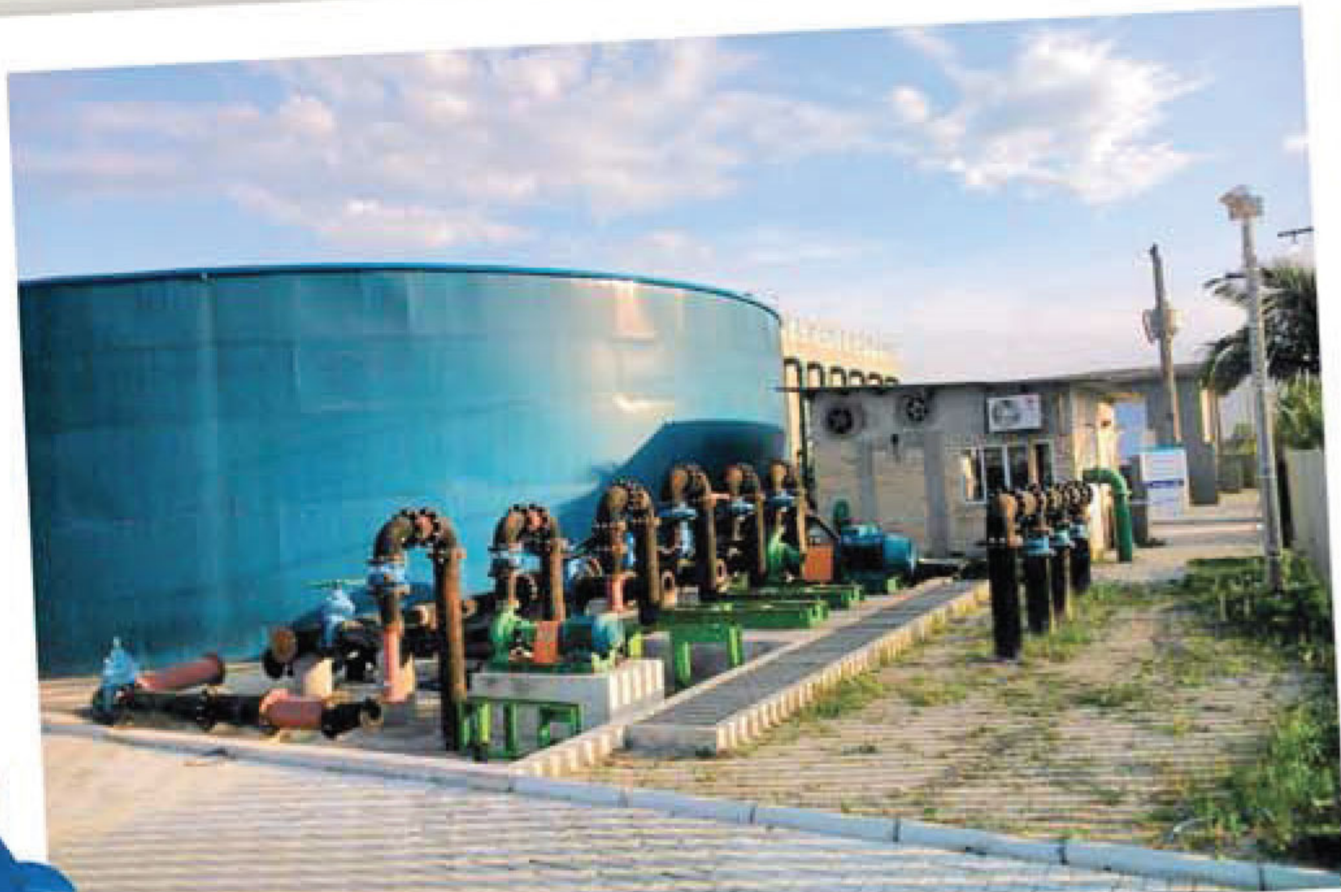
ETA em Morretes

Meta é continuar garantindo abastecimento contínuo na alta temporada de verão