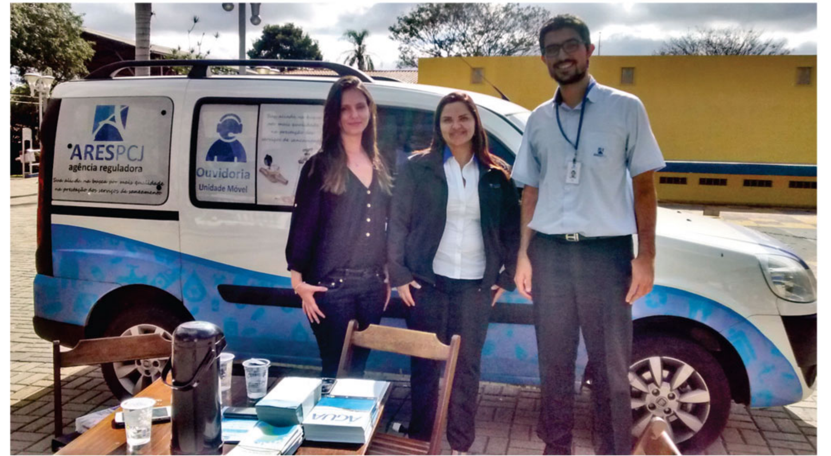
População recebeu informações e tirou dúvidas sobre saneamento básico. Na foto, equipe da Conasa Sanesalto

O município de Salto recebeu no dia 24 de junho, a Ouvidoria Itinerante da Agência Reguladora (ARES-PCJ), que regula a prestação dos serviços de água e esgoto na cidade. Instalada na Praça XV, a Ouvidoria teve o objetivo de tirar dúvidas e oferecer atendimento e orientações à população. Representantes da CONASA Sanesalto estiveram no local para apoiar a atividade. Quem passou por lá recebeu materiais de divulgação com os direitos e deveres dos usuários, informações sobre consumo sustentável. O evento contou ainda com atendimento para sanar dúvidas e registrar reclamações.