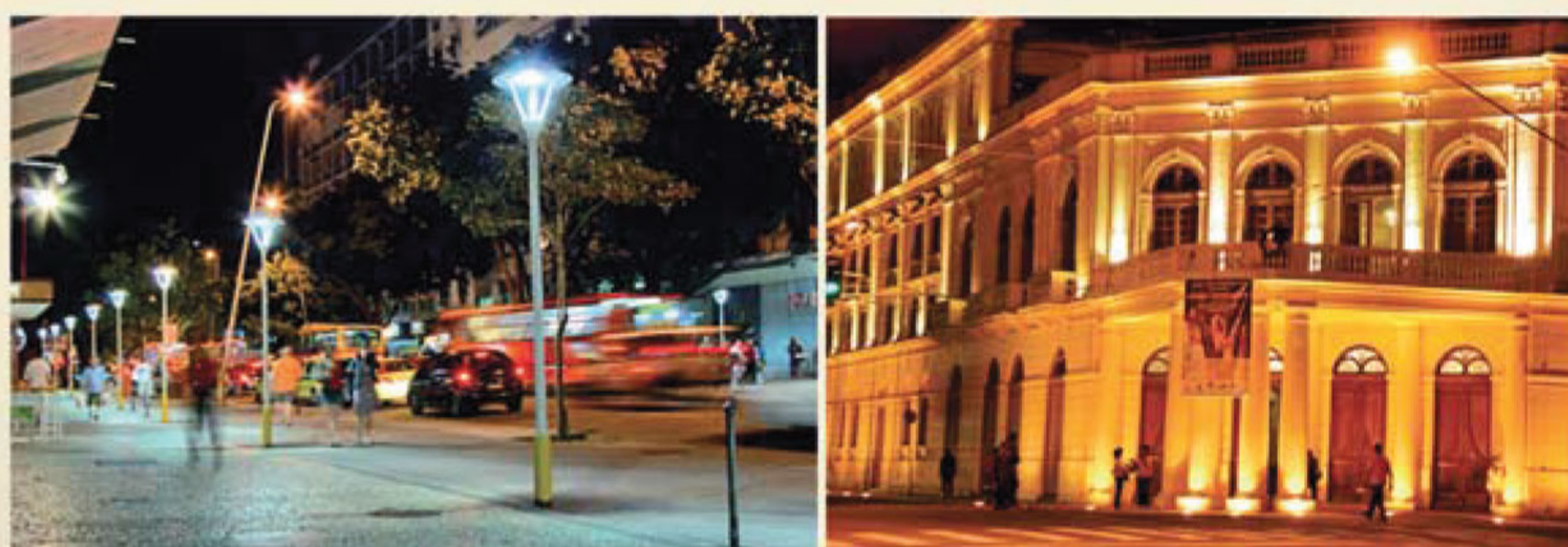
Iluminação especial em praça de Ipanema no Rio de Janeiro / RJ