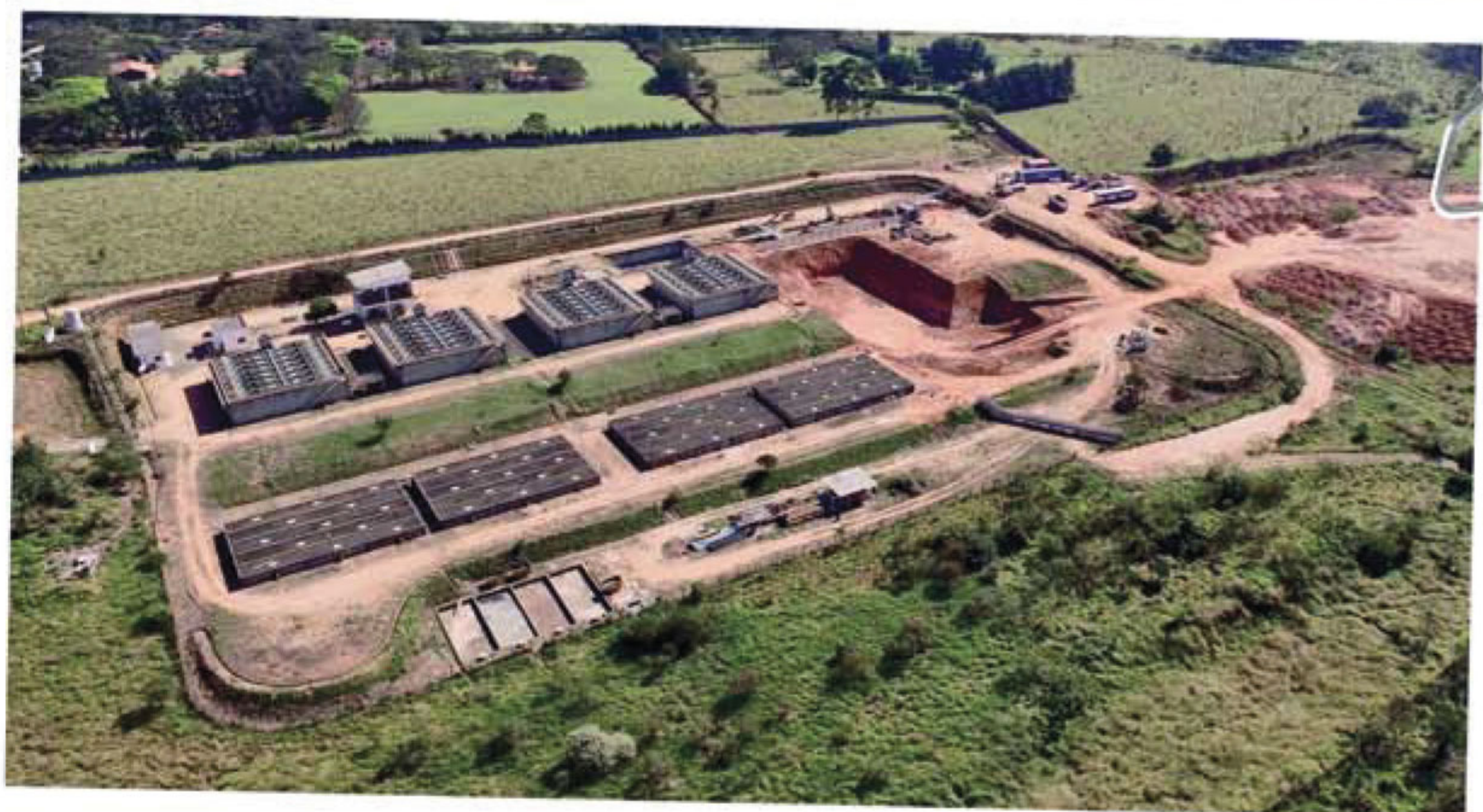
Estação de Tratamento de Esgoto da CONASA Sanesalto

No mês de abril e junho respectivamente, a CETESB – Companhia Ambiental do Estado de São Paulo - e a ARES-PCJ – Agência Reguladora – realizaram coletas de amostras semestrais na Estação de Tratamento de Esgoto da CONASA Sanesalto para análise periódica da qualidade e da eficiência do tratamento do efluente. Nos ensaios, ambas comprovaram que a Companhia atende aos parâmetros exigidos pelos entes fiscalizadores e reguladores do setor.